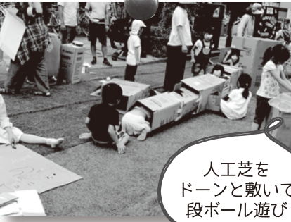
人工芝をドーンと敷いて段ボール遊び

三鷹では子育てコンビニが中心となって、三鷹駅前の商店街などで不定期に開催しています