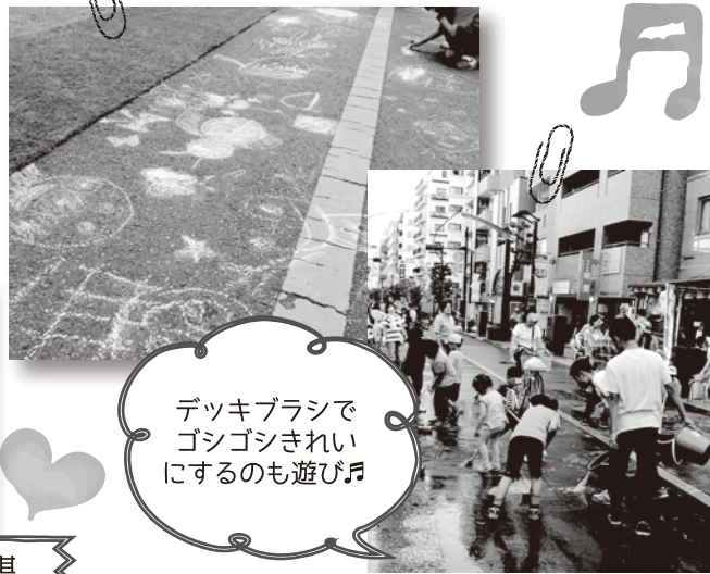
デッキブラシでゴシゴシきれいにするのも遊び♪

やってきた子ども達に、大人は遊び方を指示したりはしません。あくまでも子どもたちが自発的に遊ぶのをさりげなく手助けするだけ。子どもは遊びの専門家！