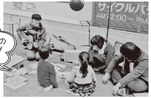
歌とギターのミニライブ

やってきた子ども達に、大人は遊び方を指示したりはしません。あくまでも子どもたちが自発的に遊ぶのをさりげなく手助けするだけ。子どもは遊びの専門家！