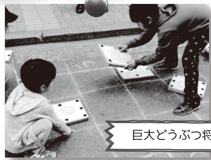
巨大どうぶつ将棋

少し大きな子が小さな子にデッキブラシを自然に譲ります。ボランティアで中学生が参加してくれることも！